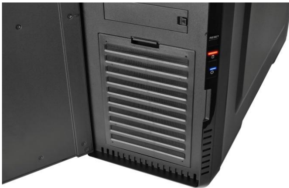
前置風扇可拆式防塵濾網