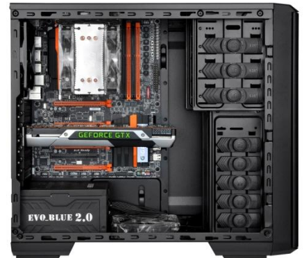
預留顯示卡長度高達 12.5吋