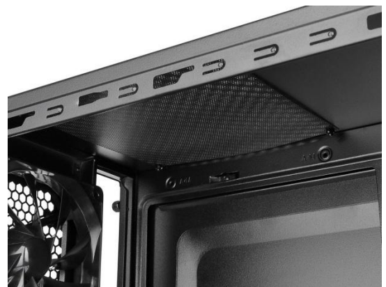
上置風扇可拆式防塵濾網